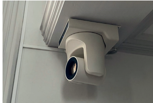
Bild- und Tonübertragungstechniken bieten neue und ungewohnte Perspektiven. Unserer Lösung für die Kameraübertragung lässt fast keine Wünsche offen. Egal, ob es eine Übertragung in ein anderes Gebäude sein soll oder mit einem Streamingdienst via Internet. Jede Lösung ist individuell abgestimmt.

Livestream ist in aller Munde. Gerade in den vergangenen Monaten haben sich viele Kirchen und Gemeinden der Videoübertragung geöffnet und ihre Veranstaltungen via Internet übertragen.